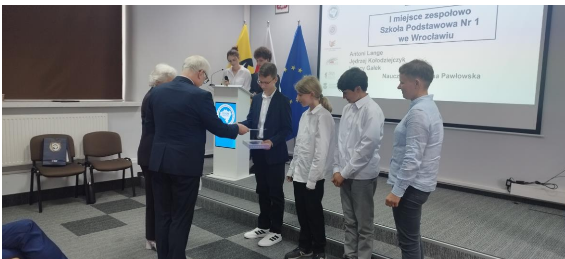
Wręczenie nagród laureatom: Dyrektor NBP, Prezes Pro Mathematica i Dziekan UE.