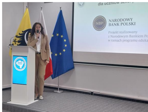
Przemówienia gości honorowych: Dyrektor NBP i Prezes Fundacji Pro Mathematica