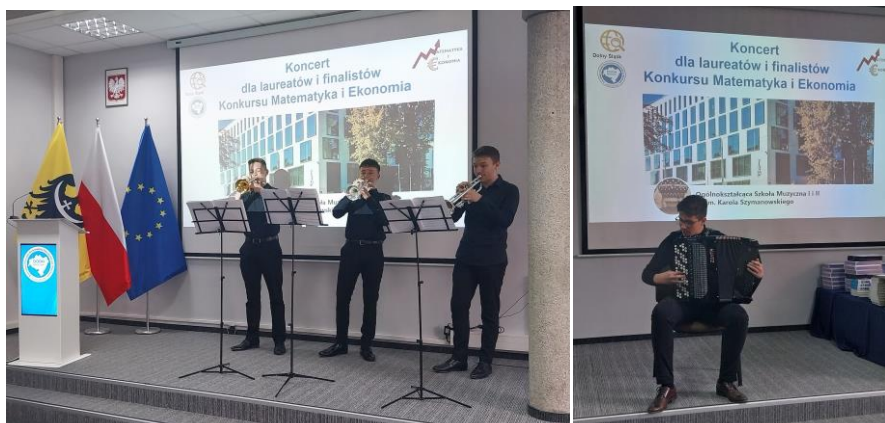
Występ uczniów OSM I i II stopnia we Wrocławiu