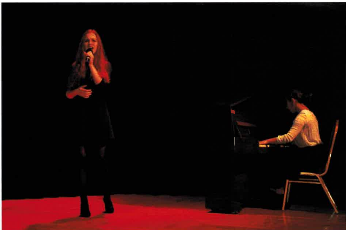
Uczniowie śpiewający utwory Zbigniewa Herberta.